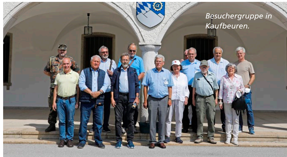
Besucherguppe in Kaufbeuren.